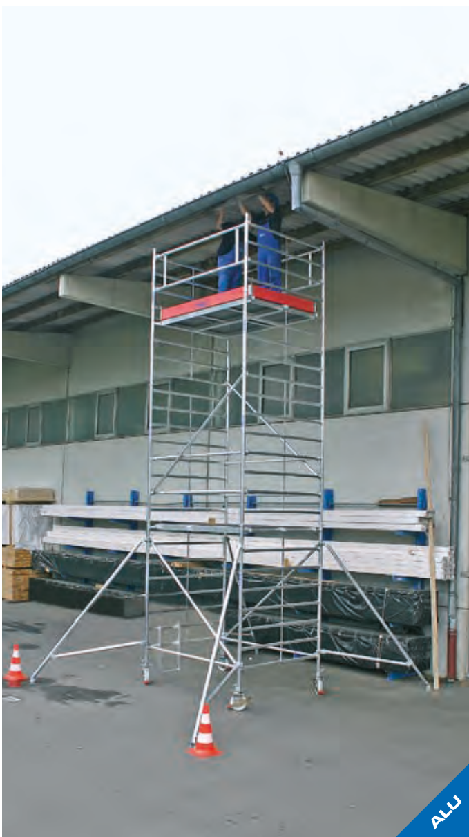
Állványmező hossza: 2,00 m – Mező szélessége: 1,50 m

A felépítési változat függvényében ballaszt súlyokat kell használni (kiegészítőként rendelhető). A ballaszt súlyokra vonatkozó adatok a felépítési és használati útmutatóban vagy a weboldalunkon találhatóak meg. A rendszerelemek a 154. oldaltól kezdődően találhatók meg.