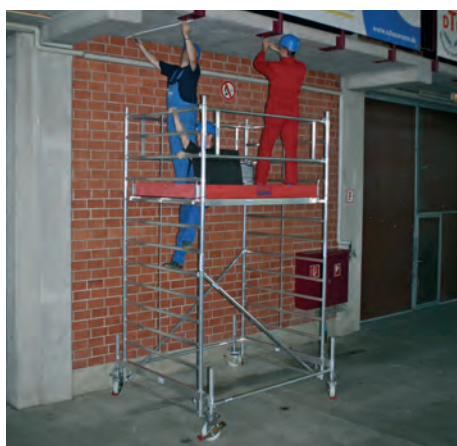
Állványmező hossza: 2,00 m – Mező szélessége: 1,50 m