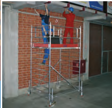
Állványmező hossza: 2,00 m – Mező szélessége: 1,50 m