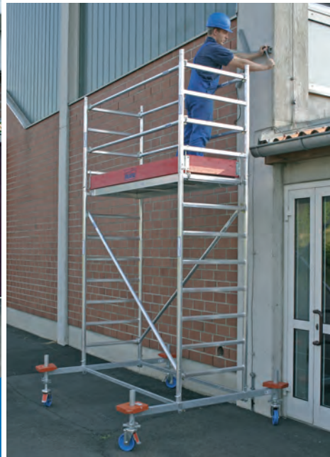
Állványmező hossza: 2,00 m – Mező szélessége: 0,75 m