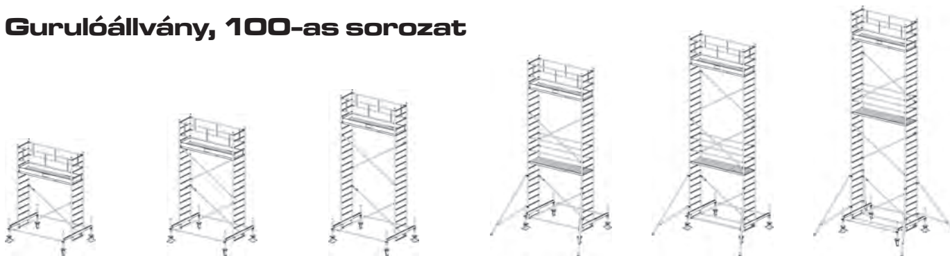
Munkamagasság: 4,40 m Állványmagasság: 3,40 m Állómagasság: 2,40 m