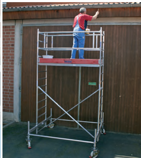
Állványmező hossza: 2,00 m – Mező szélessége: 0,75 m