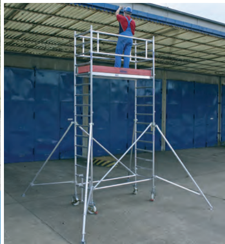
Állványmező hossza: 2,00 m – Mező szélessége: 0,75 m