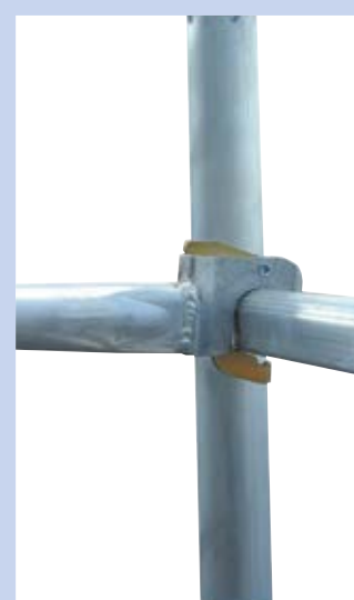
Gurulóállvány-rendszerek szabadalmaztatott csatlakozási rendszerrel

A szabadalmaztatott csatlakozás akár egy ember számára is lehetővé teszi a korlát rudak és az átlók gyors és egyszerű be- és kiakasztását – szerszám nélkül. A rögzítési pontok alakzárásból erőzáró kapcsolattá alakíthatók át, így különösen nagy stabilitást kölcsönöznek az állványnak. Az alak- és erőzárás kapcsolatok további előnye abban rejlik, hogy pl. a korlát rudak véletlen kiemelése akár az egyszerű beakasztás után sem lehetséges. A járólapok, átlós merevítők és korlátok egységes rögzítései jelentősen leegyszerűsítik az összeszerelést.