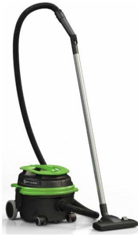
Go Work Dry