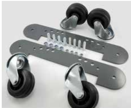
Kerékkészlet a védőkeret alá szereléshez (cikkszám: 78861413)