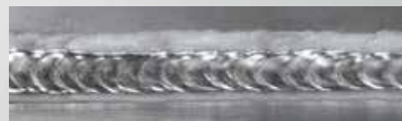
DUO Plus™ - Alumínium

A funkció javítja a hegesztési fürdő szabályozását, és csökkenti a hőbevitelt.