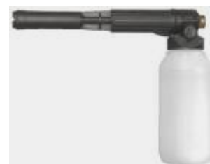
LS-12 ( 2 l )