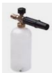
LS-3 ( 1 l )