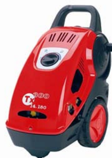
TX 500 / 300