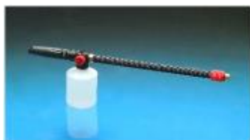
TXFOAM KIT ( 0,5 l )