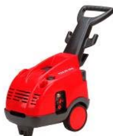
TSX / TX