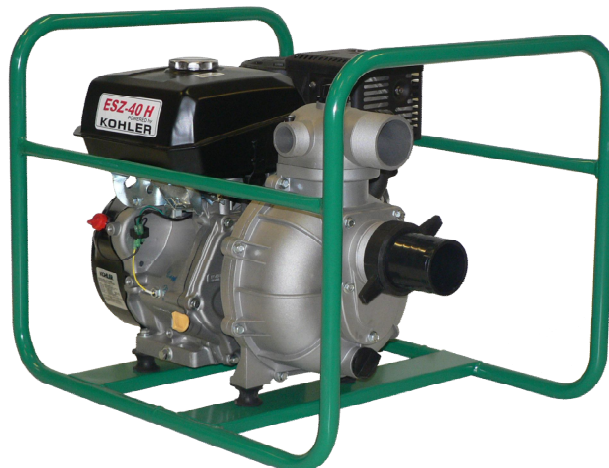
ESZ-40 H Kohler benzínmotorral