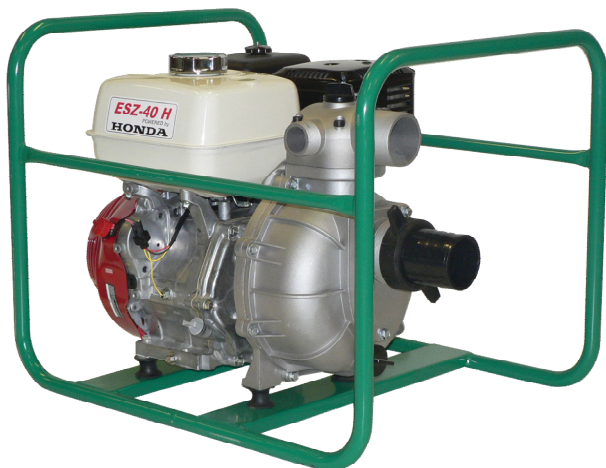
ESZ-40 H Honda benzínmotorral

A meghajtó HONDA vagy KOHLER benzinmotor hosszú élettartamot és megbízható, gazdaságos üzemelést biztosít. A szivattyúk önfelszívó kivitelűek.