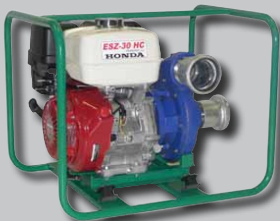
ESZ-30 HC Honda benzínmotorral

Az ESZ-30 HC sorozatú öntözőszivattyúk elsősorban mezőgazdasági öntözési célokra alkalmasak. A szivattyúk szerkezetükből adódóan nagy nyomás mellett tudnak jelentős mennyiséget szállítani, kisebb öntöződobok táplálására kiválóan alkalmasak. Ebből kifolyólag a mezőgazdaságban igen jól használhatók. A meghajtómotor HONDA vagy KOHLER benzinmotor, de lehet LOMBARDINI dízelmotorral is rendelni. Bármelyik motor hosszú élettartamot és megbízható, gazdaságos üzemelést biztosít.