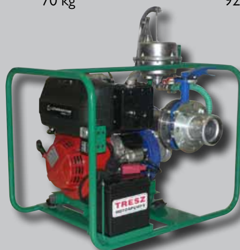
ESZ-30 HC Lombardini dízelmotorral, kézi feltöltőpumpával

Az ESZ-30 HC öntvényházas kivitelű, hosszú élettartamú szivattyú. Nem önfelszívó, ezért a szivattyúzás megkezdése előtt a teljes szívóágat fel kell tölteni vízzel. Ehhez opcióként kézi felszívópumpát ajánlunk pillangószelepes elzáróval. A szivattyúhoz a lábszelep alaptartozék. A csatlakozók igény szerint Bauer vagy Storz csatlakozók lehetnek. A LOMBARDINI dízelmotoros változat önindító dízelmotorral szerelt, hosszú élettartamú, takarékos üzemű gép.