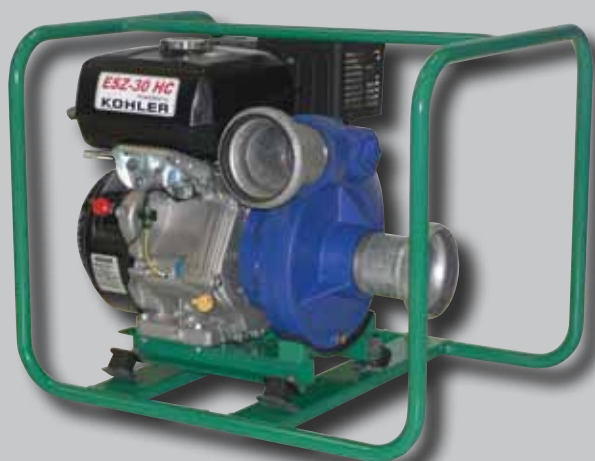
ESZ-30 HC KOHLER benzínmotorral