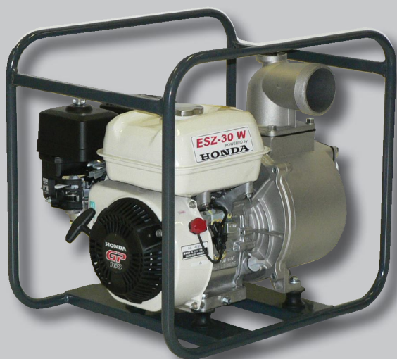
ESZ-30 WA-GP 160 motorral