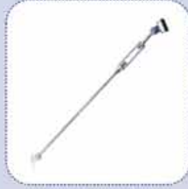
cod. S150-S4000 - MENETES FESZÍTŐ - Support with tie rod - Support à tirant - Zugstangenstütze - Tirante Unificado