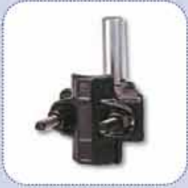
cod. 0007200000 - CSŐBILINCS - Fixing clamp - Collier de fixation - Klemme - Mordaza/Enlace sobresaliente