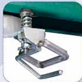
cod. 5439243102 - FÉK - Parking brake unit - Groupe frein de stat. - Feststellbremse - Freno de estacionamiento