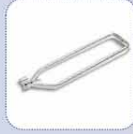
cod. 9223816600 - ALSÓ MEGTÁMASZTÓ - Lower support - Support inférieur - Untere Abstützung - Soporte inferior