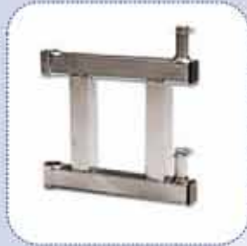
cod. 1616519800 - 35 cm TARTÓ - Parallelogram - Parallélogramme - Parallelogramm - Paralelograma