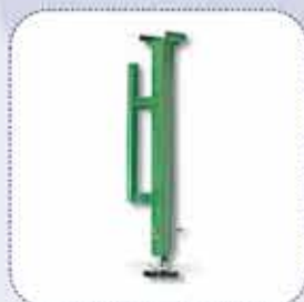
cod. 0007400000 - ABLAKDARU - Window strut - Chevron fenêtre - Fensterstütze - Puntal a ventana