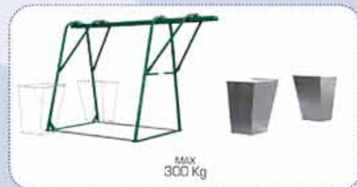
cod. 9200810600 - PORTÁL-DARU - Trestle - Chevalet - Traggerüst - Caballete