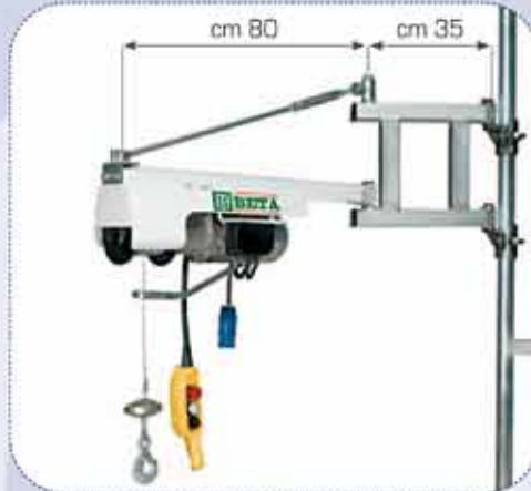
- TARTÓ ALKALMAZÁSA - Example of application - Exemple d'application - Anwendungsbeispiele - Ejemplo de aplicación