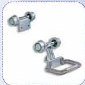
cod. 5439243101 - FUTÓMACSKA - Kit Wheels - Kit Galets - Rollensatz - Set carro