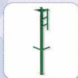
cod. 0007300000 - TELESZKÓPOS FÖDÉMDARU - Window strut - Chevron fenetre - Geschoß stütze - Puntal a techo